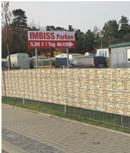
Proraer Allee 119